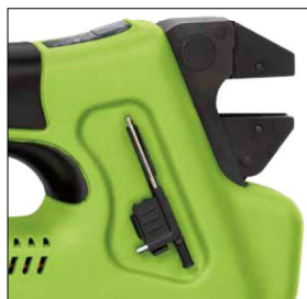
Montagewerkzeug für Crimpgesenke direkt am Werkzeug Crimp die installation tool right on the crimper