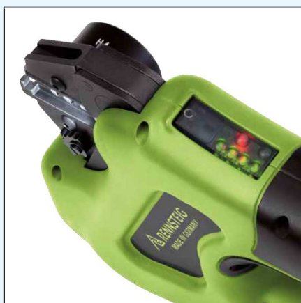
Prozessüberwachung - immer im Blick