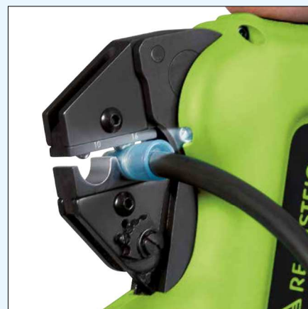
Beleuchtung des Arbeitsbereiches