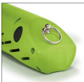
Resetknopf und Fangsicherung Reset button and lanyard ring