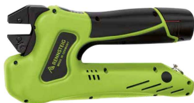
sicherer Stand bei ergonomischer Arbeitshöhe Steady stand at an ergonomic working height