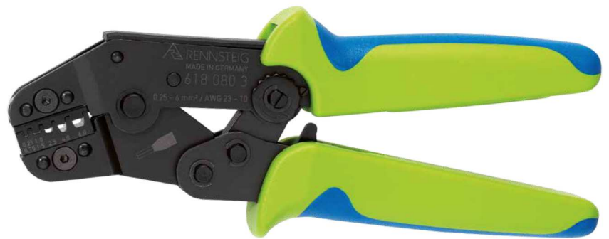
Art. No. 618 080 3