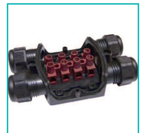
Morsetteria STD passo 12 Standard terminal block 12

Eventuali modifiche e migliorie sui dati tecnici o sul prodotto potranno essere effettuate senza preavviso. All technical data or other eventual product modifications and improvements can be carried out without notice.